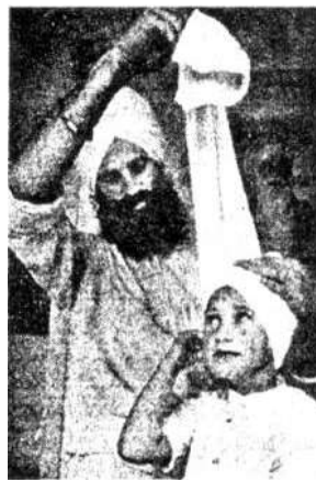
ଚିତ୍ର-୧ : ଏକ ଶିଖ ବାଳକ ନିଜ ପିତାଙ୍କଠାରୁ ପଗଡ଼ି ପିନ୍ଧିବା ଶିଖୁଛି

ସାମାଜିକୀକରଣର ମୁଖ୍ୟ ଉଦ୍ଦେଶ୍ୟ ହେଲା ବାଳକ / ବାଳିକା ମାନଙ୍କୁ ପ୍ରତିଷ୍ଠିତ ପ୍ରତିମାନ ଓ ବ୍ୟବହାର ଧାରା କୁ ବୁଝିବାକୁ ବାଧ୍ୟ କରିବା । ପ୍ରଚଳିତ ସ୍ଥିତି ଅବସ୍ଥା ଅନୁଯାୟୀ ବାଳକ-ବାଳିକା ମାନଙ୍କୁ ଲାଳନ ପାଳନ କରାଯାଏ । ସମାଜର ସ୍ୱୀକୃତ ରୀତିନୀତି, ପ୍ରତିମାନ ଓ ମୂଲ୍ୟବୋଧ ଅନୁଯାୟୀ ଜଣେ ବ୍ୟବହାର ଓ ଆଚରଣ ବିଧି ଶିକ୍ଷା କରିଥାଏ । ଏହା ଶିଶୁର ସାଂସ୍କୃତିକୀକରଣ ଦିଗରେ ପ୍ରଥମ ସୋପାନ ଯେଉଁଠି ଠାରେ ସେ ପ୍ରଚଳିତ ପର୍ଯ୍ୟାବରଣ ମଧ୍ୟରେ ନିଜର ପରିଚୟକୁ ଖୋଜି ପାଇଥାଏ । ସାମାଜିକୀକରଣର ବାହକ ମାନେ ସାମାଜିକ ବିରୁଦ୍ଧି ତଥା ପିଲାଙ୍କ ବିରୁଦ୍ଧି ମୂଳକ କାର୍ଯ୍ୟର ନିୟାନ୍ତ୍ରଣ କରିଥା'ନ୍ତି । କିନ୍ତୁ ପରବର୍ତ୍ତୀ କାର୍ଯ୍ୟ କୁ ନିୟନ୍ତ୍ରଣ କରିନଥା'ନ୍ତି । ପିଲାମାନଙ୍କର ବିରୁଦ୍ଧି ମୂଳକ କାର୍ଯ୍ୟକଳାପ କୁ ଅସ୍ୱୀକାର କରି ହେବ ନାହିଁ ।