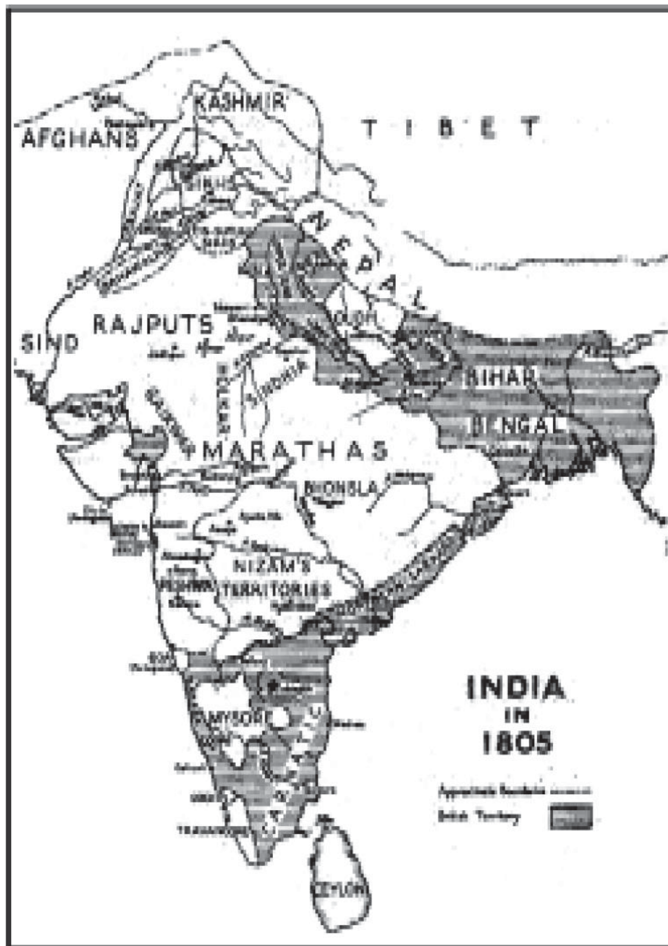
ମାନଚିତ୍ର ୧୭.୨: ୧୭୯୭-୧୮୦୫ ମଧ୍ୟର ଭାରତ

ପ୍ରତିଷ୍ଠା ହେଲା । ଲର୍ଡ୍ ୱେଲେସଲିଙ୍କ ଦ୍ୱାରା ୧୭୯୮ ମସିହାରେ ସହାୟକ ସନ୍ଧି ପ୍ରସ୍ତାବ ଅଣାଗଲା । ଏହି ସନ୍ଧି ଅନ୍ତର୍ଗତ ଇଂରେଜ ଭାରତୀୟ ଦେଶୀୟ ରାଜ୍ୟମାନଙ୍କର ବହିଃ ଶତ୍ରୁ-ବିପଦ ତଥା ଅନ୍ତର୍ଭୁକ୍ତିରୁ ରକ୍ଷା କରିବାକୁ ସ୍ୱୀକାର କଲେ । ଏହା ବଦଳରେ ଏହି ସନ୍ଧିକୁ ସ୍ୱୀକାର କରିଥିବା ଭାରତୀୟ ଶାସକମାନଙ୍କୁ ଇଂରେଜ ସୈନ୍ୟ ଦଳର ଛାଉଣୀ କରି